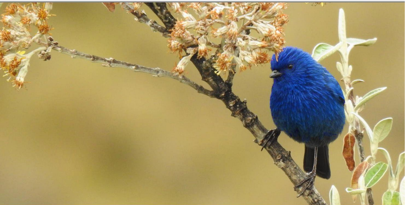
Синяя птица в парке Кахас.

К самому высокому пункту, который называется «Три Креста», можно доехать по дороге; это место также является водоразделом: одни реки впадают в Тихий океан , а другие текут к океану Атлантическому .