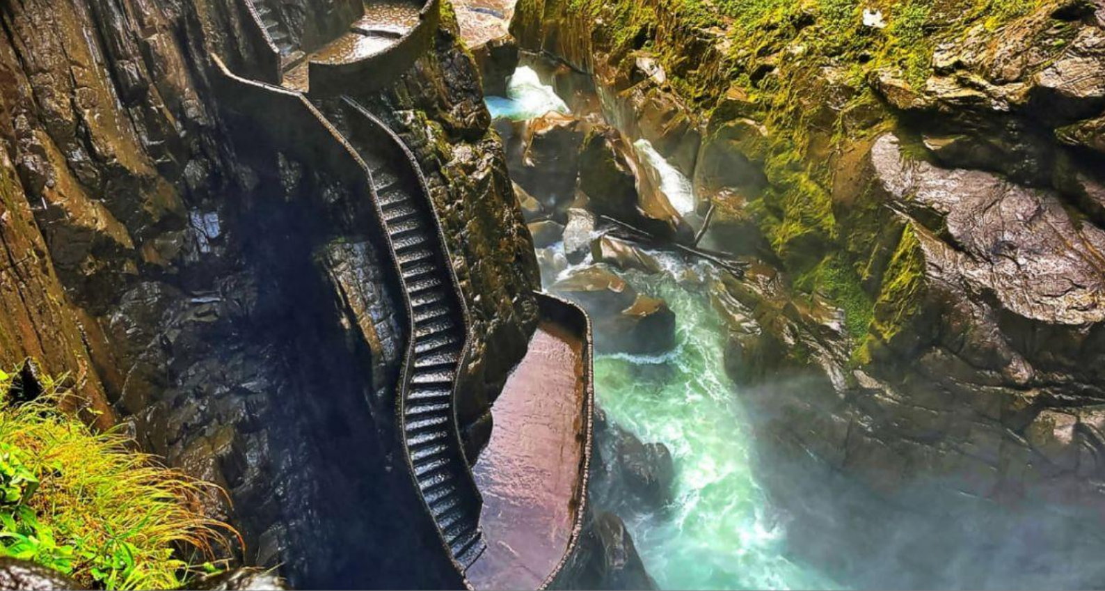
Водопад «Дьявольская сковорода».

Во второй половине дня отправляемся в город Риобамбу . Свободный вечер.