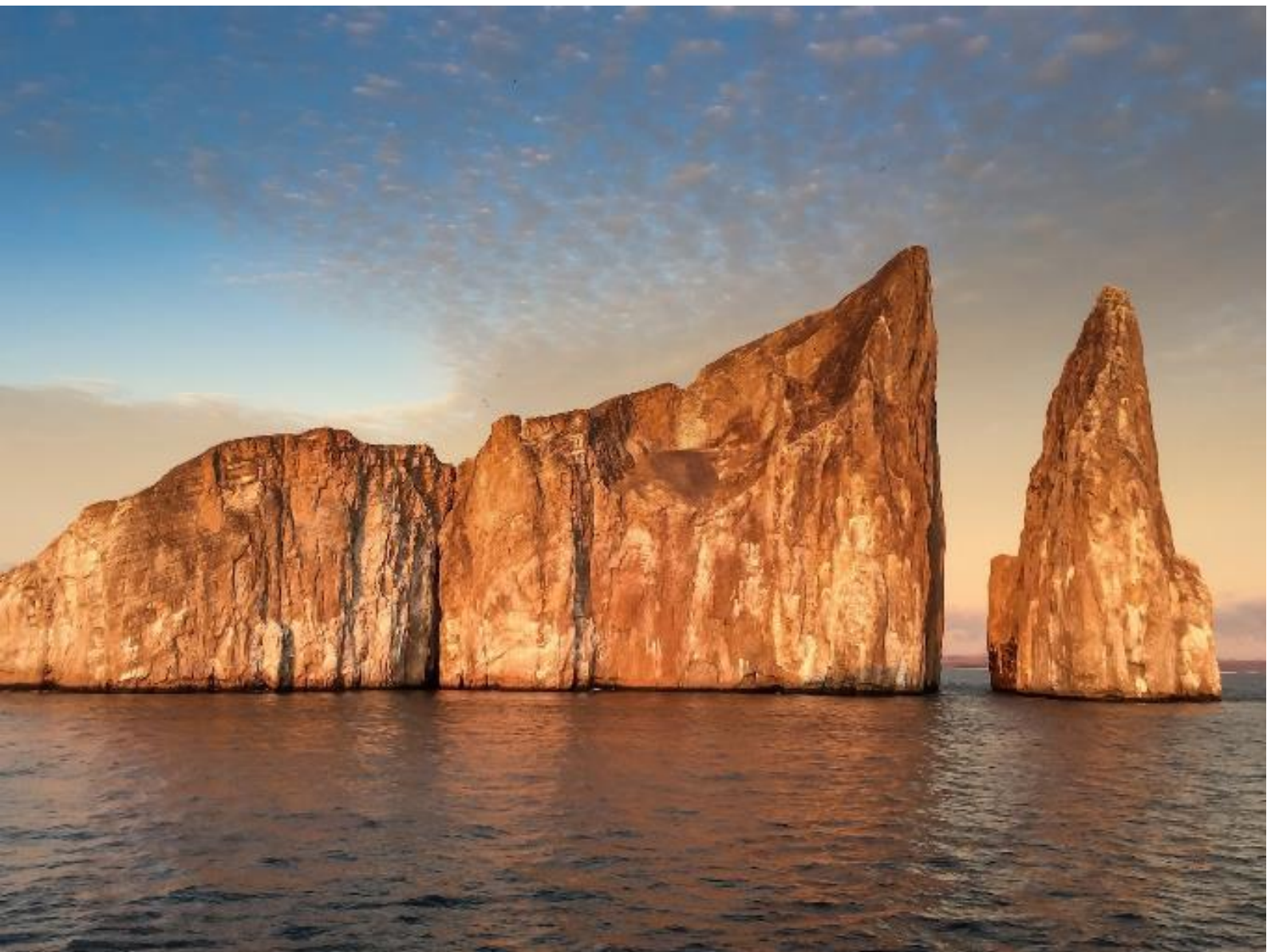
Скала Спящий Лев

Морская экскурсия на остров Сеймур или Пласа (подтверждается после бронирования; оба острова одинаково интересны).