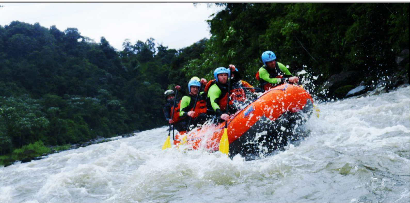
Рафтинг на Кихосе.

Утром руководитель проведет тщательный инструктаж по безопасности и пробный заплыв. Затем вы разделитесь на группы для тренировки в лодке с вашим гидом.