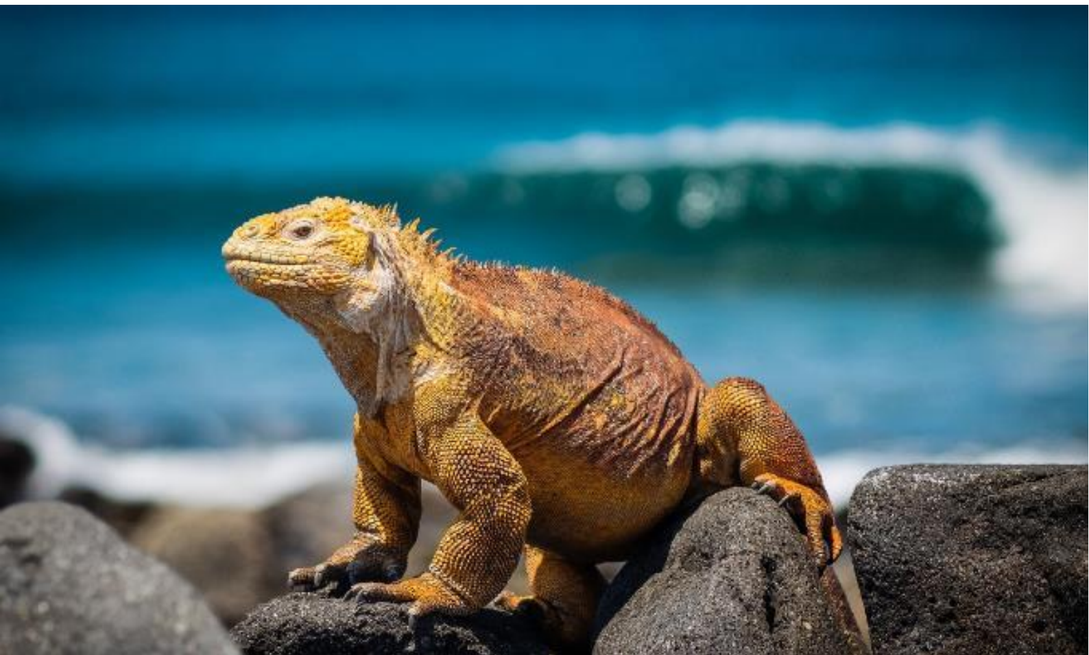
Галапагосская морская игуана

Это место является средой обитания тысяч птиц. Открывающийся с вершины пейзаж – это символ Галапагосских островов, запечатленный многими фотографами.