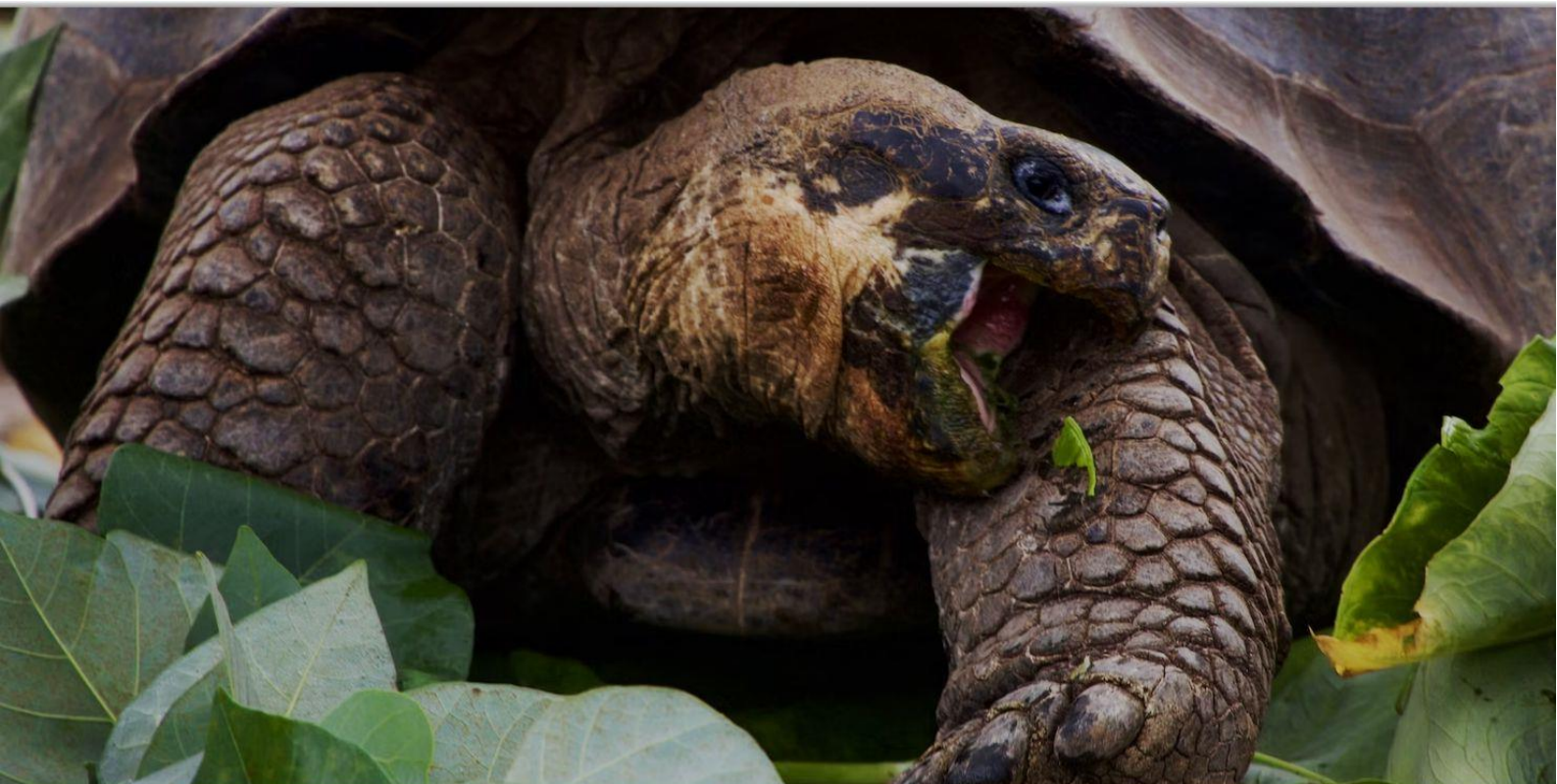
Галапагосская черепаха дала свое название островам.

Обратите внимание на изменение окружающей среды: от красной каменистой поверхности на севере к зеленому миру живой природы на высокогорье и юге.