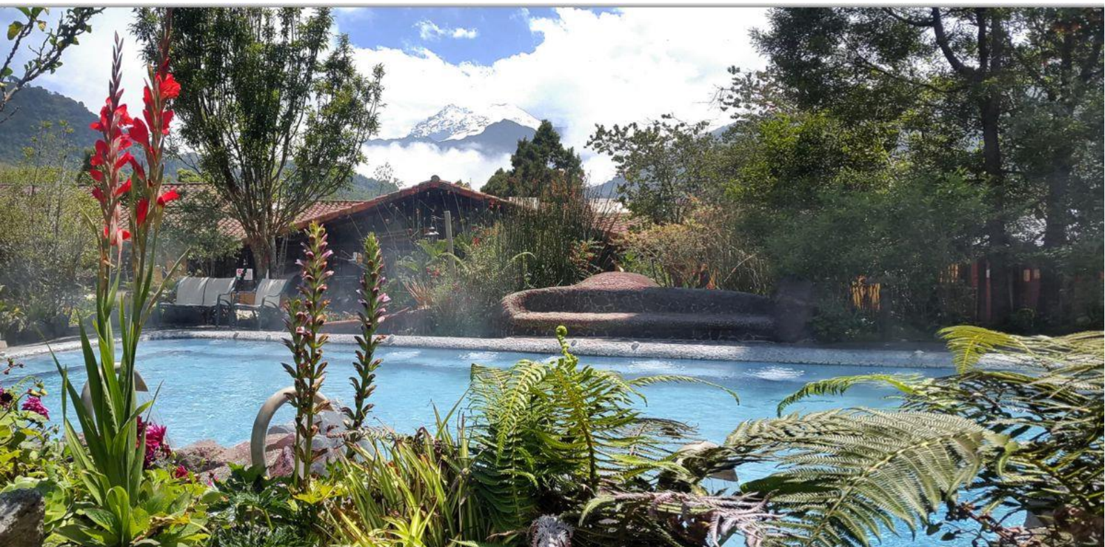
SPA-бассейн на курорте Папаякта.

По прибытии в Папаякту вы сразу вдохнете чистый воздух – результат столкновения амазонских ветров со скалами, лесами и реками Андского региона. Курорт Termas de Papallacta гарантирует своим посетителям здоровье, восстановление и отдых – три важных причины, чтобы посетить и насладиться окружающей средой, излучающей гармонию.