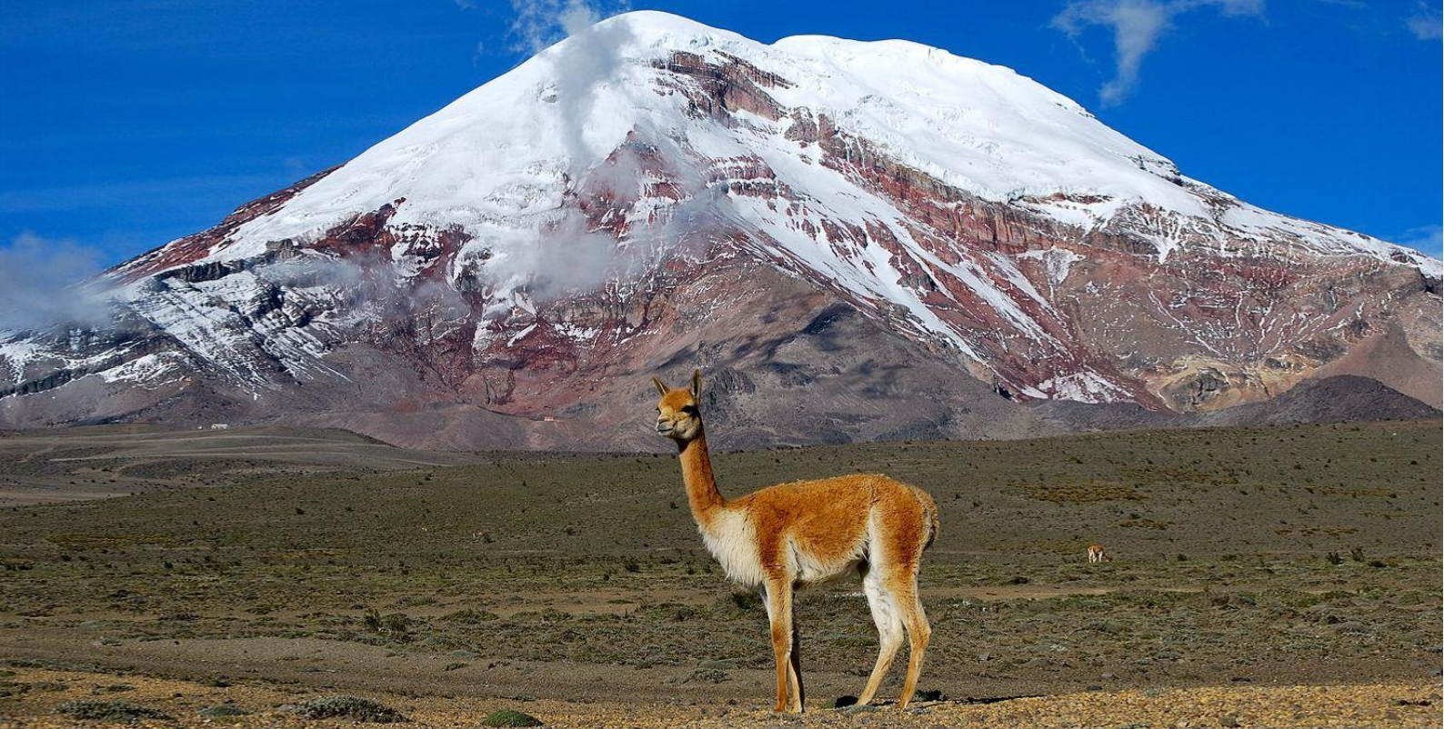
Грациозная викунья на фоне вершины Чимборасо.

Создание этого заповедника имело под собой цель вновь заселить эти территории аборигенными видами, в данном случае привезли викуньи из Перу и Чили , где они до сих пор живут в естественных условиях. Таким образом, заповедник сформировал и управляет дикими популяциями, из которых в дальнейшем получит ценную шерсть.