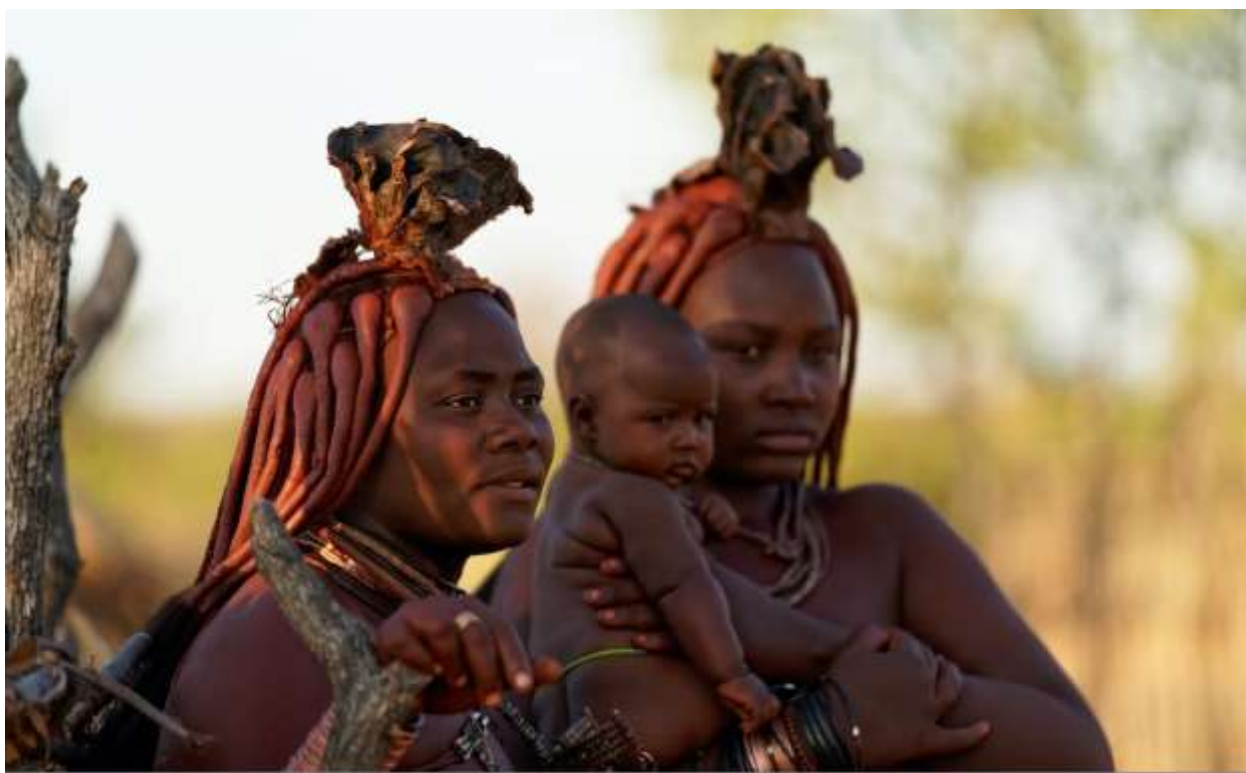
Химба в Намибии. Июль 2022 г.

По дороге экскурсия в деревню племени Химба . Большинство Химба живут в поселениях и до сегодняшнего дня следуют традициям предков как в одежде, так и в поведении. Вы обязательно обратите внимание на необычный «макияж» женщин, разнообразие ожерелий, браслетов, а также других всевозможных украшений, которые носят все представители племени: дети, женщины и мужчины.