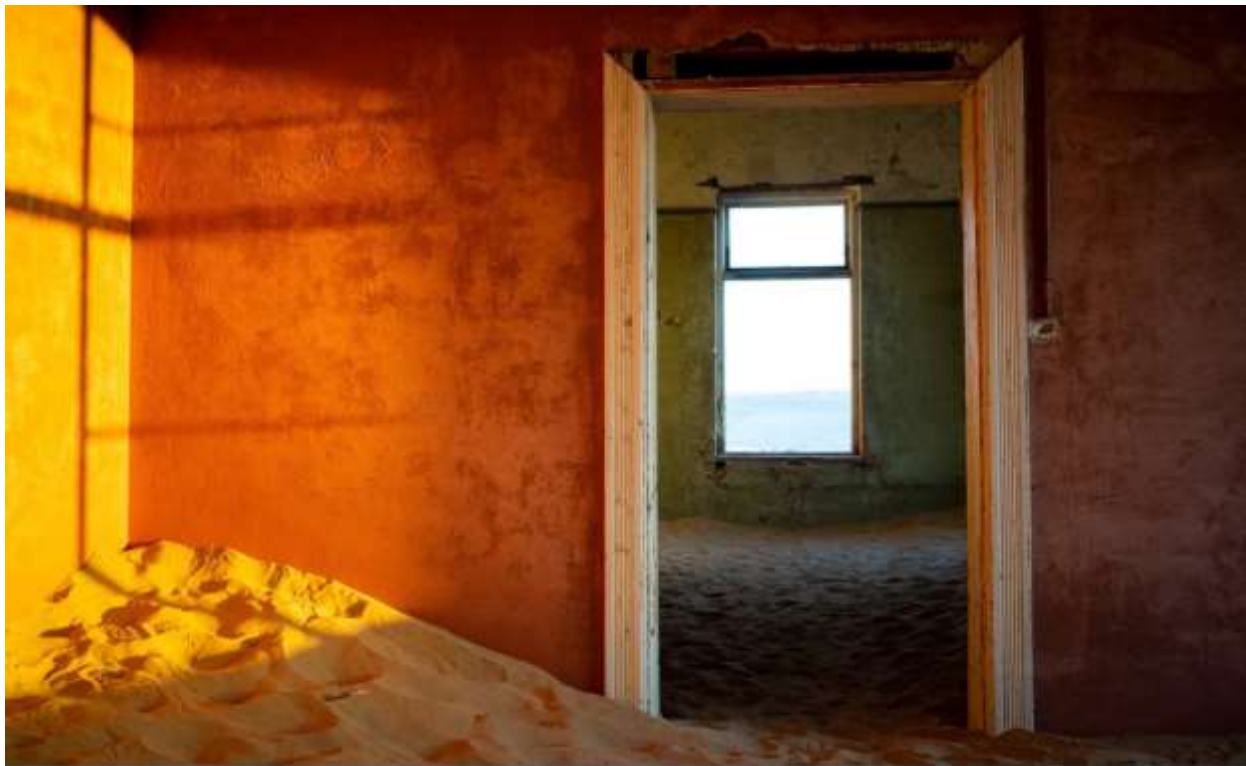
Дом, занесенный песками. Апрель 2020 г.

Фотографы со всего мира съезжаются сюда для ТОПОВЫХ СНИМКОВ .