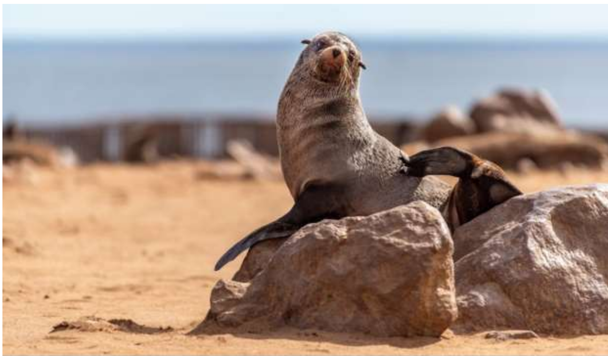
Ушастый тюлень, Намибия. Апрель 2022 г.

Увлекательная экскурсия по Атлантическому океану на катамаране к мысу Пеликанов . Вас ждет встреча с обитателями морских глубин, тюленями, дельфинами, китами (в сезон). Подготовьтесь к визиту ручных тюленей и дельфинов, которые посетят вас на борту во время круиза.