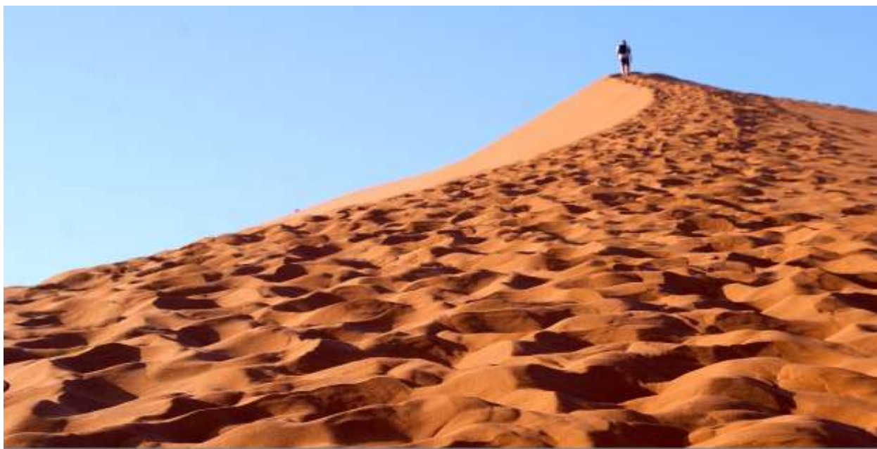
Подъем на дюну в Соссусфлее. Июль 2020 г.

В этот день вас ждет поездка в дюны , красные и загадочные, освещенные первыми лучами восходящего солнца. Вы посетите « Мертвую долину » и поднимитесь на дюны, с которых откроется сказочный вид пустыни.