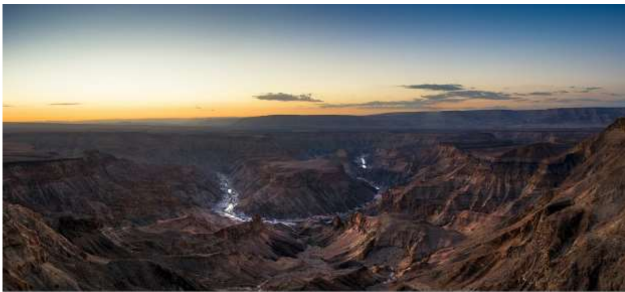
Каньон Фиш-Ривер, Намибия. Декабрь 2021 г.

Фиш-Ривер – самая большая внутренняя река Намибии . Но ее нельзя назвать постоянной. Она протекает по территории страны с перерывами. Полноводной река обычно становится в феврале (это летний месяц для южного полушария). В остальное время она выглядит цепочкой длинных узких водоемов.