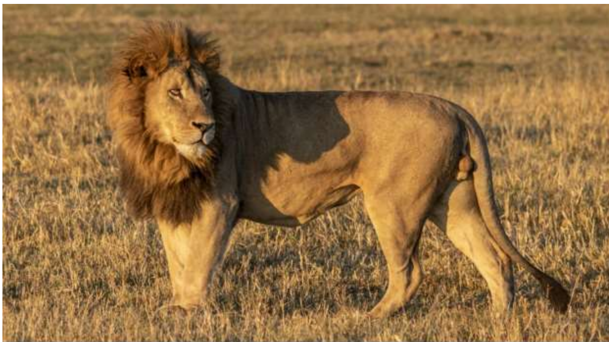
Лев на закате в заповеднике Мореми. Май 2022 г.