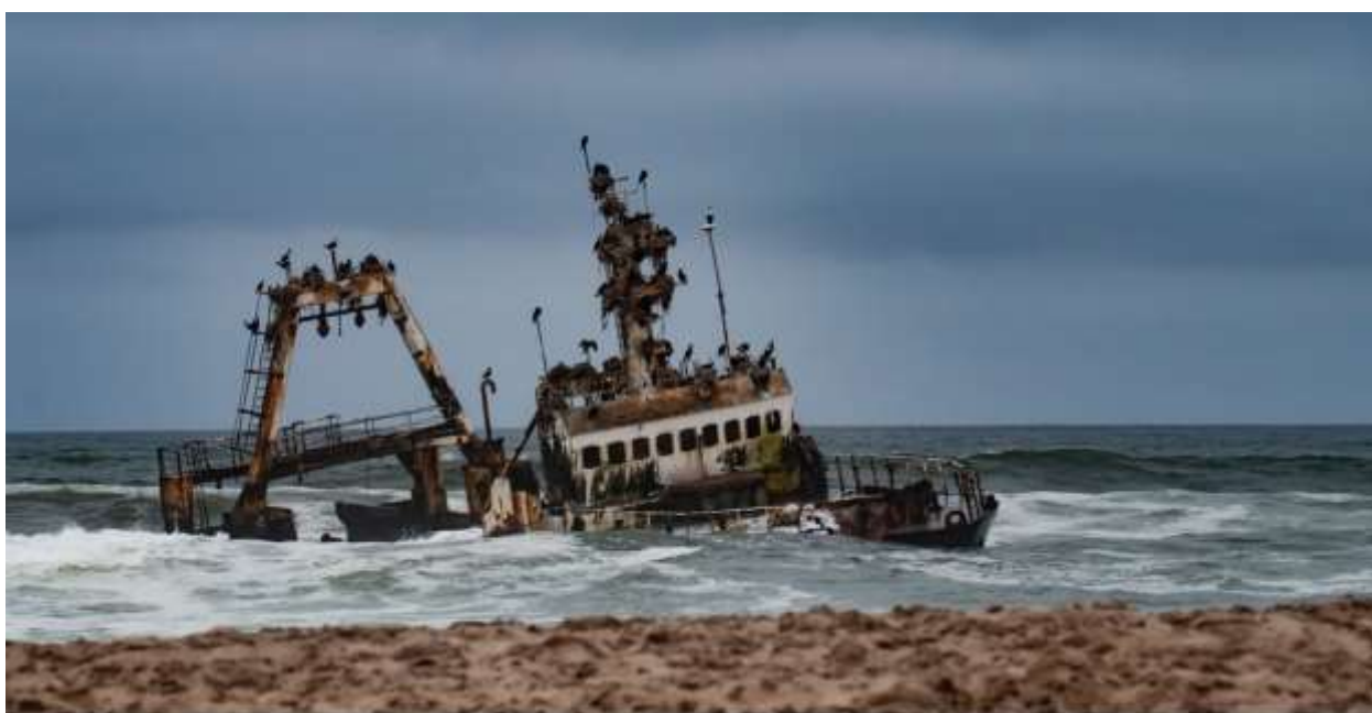
Один из призраков Берега Скелетов в Намибии. Февраль 2019 г.

Вам предстоит увлекательная поездка вдоль побережья к колонии пушистых тюленей в районе Капского Креста, где в период размножения собирается от 80 000 до 300 000 этих морских млекопитающих. Вы поразитесь красотой обширно растущих на камнях мхов и лишайников, а также обитающих на солёных озёрах очаровательных фламинго и пеликанов.