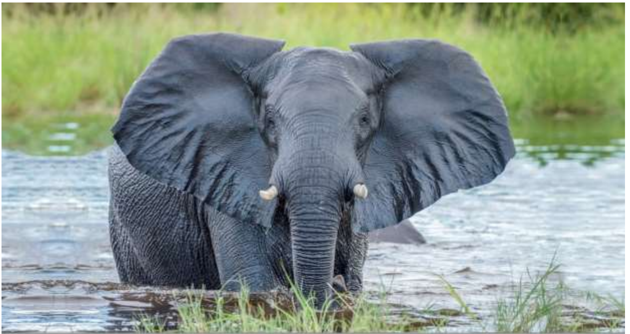
Африканский слон в дельте Окаванго. Июнь 2019 г.

Утреннее и послеобеденное сафари в дельте реки Окаванго (по суше или по воде) зависит от уровня воды.