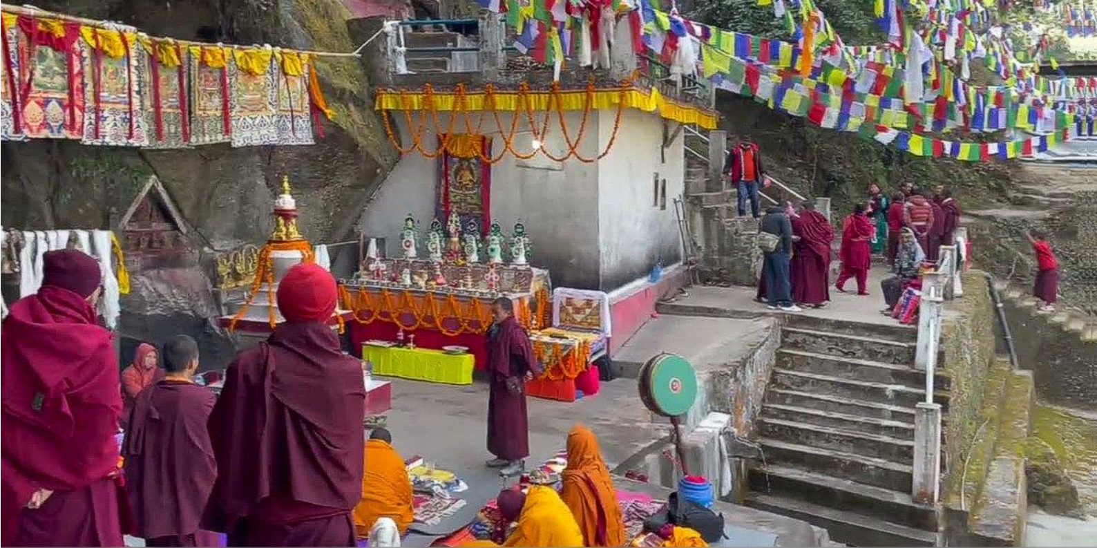
На священном источнике Просветления. Январь 2024 г.

Выезд в горный курорт Даман (ок. 3 ч., 2400 м), расположенный на холме, откуда открывается великолепный вид на весь Гималайский хребет в окрестностях Эвереста .